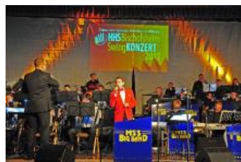
Die befreundete „MSS Big Band“ unterstützte den Handharmonikaspielring im mit 500 Besuchern ausverkauften Bürgerhaus.

Es liegt in der Natur des Instrumentes, dass der HHS mit seinen Nummern im Programm nicht ganz den Schalldruck und die Explosivität erreichte wie die auf jazzige Erfordernisse maßgeschneiderte Besetzung der Big Band von Thorsten Mebus. In Sachen Dynamik und was die Vielfalt an Klangfarben angeht,